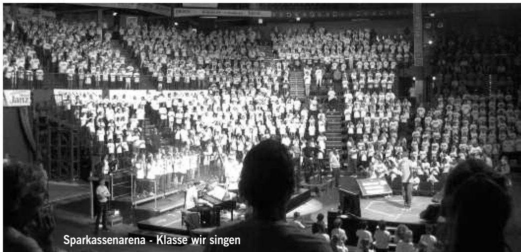
Sparkassenarena - Klasse wir singen

Der Juni und der Juli standen ganz im Zeichen des Sports und der Musik.